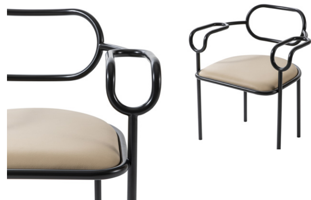
seduta con braccioli - chair with armrests

Originally designed by Shiro Kuramata in 1979, 01 Chair pays homage to the 80s and to the refined Japanese designer, who started to collaborate with Cappellini in that decade. The structure, made of polish chromed or black matt lacquered iron tube, draws a light volume, characterized by the succession of lines and arches sinuously intertwined. The seat upholstery is fixed in the leathers of the collection.